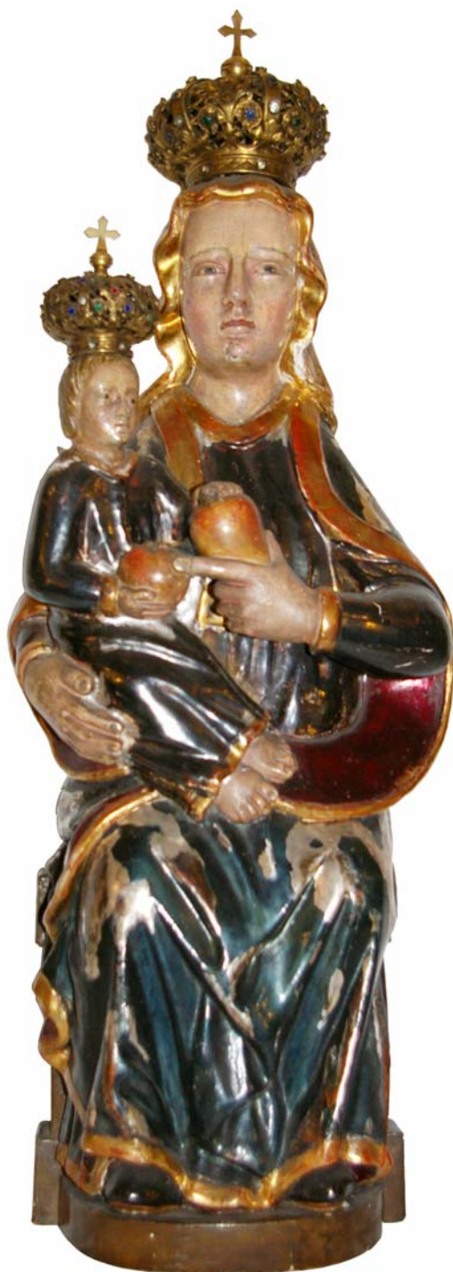
MUTTERGOTTES (M. 18. JH., NACH MARIAZELLER VORBILD) (ÄLTESTES STÜCK DER ERSTEN JOHANNES-KAPELLE A. D. WÄHRINGER LINIE)