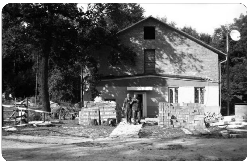
„Unser“ Obdachlosenheim bei Drohobych

Ein solches Hilfsprojekt befindet sich in der etwa 70 km südlich von Lemberg gelegenen Stadt Drohobych, einer Industrie- und Schulstadt von knapp 80.000 Einwohnern, einst Stadt mit 14 Salzminen, nicht weit entfernt von der Grenze zu Polen. Die Stadt liegt in jenem Streifen im ukrainischen Westgalizien an der Grenze zu Polen, wo einst der jüdische Bevölkerungsanteil (z.B. in Lemberg, Drohobych, Czernowitz, Mukavevo) bis zu 40 % der Gesamtbevölkerung betragen hat. Heute