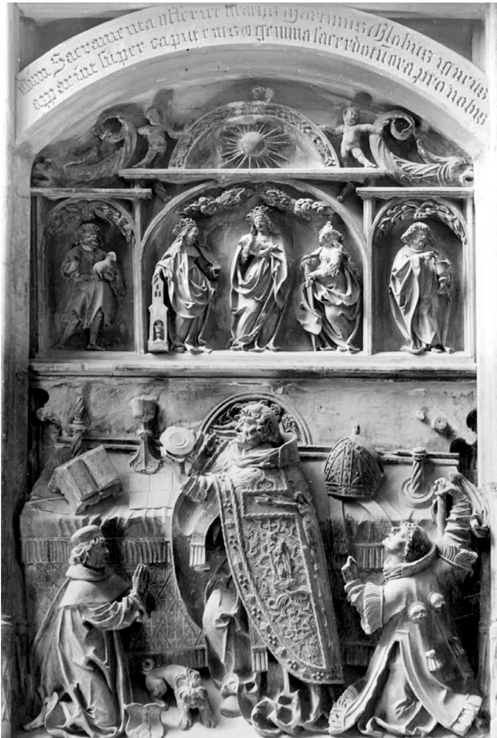
GESAMTANSICHT DES KECKMANN-EPITAPHS