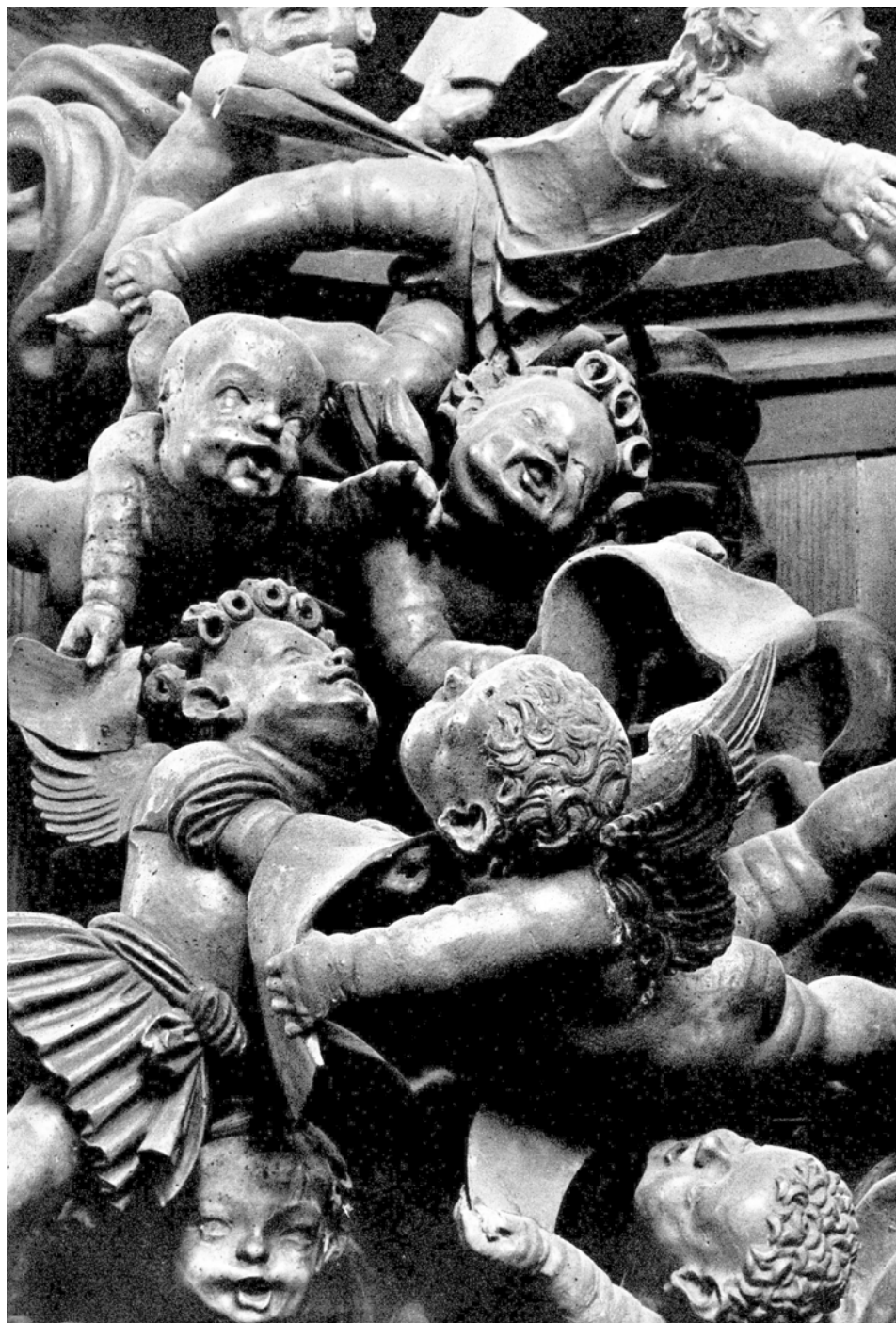
DIE JUBILIERENDEN ENGEL (MAUER BEI MELK, CA. 1520)

FOTO: FEUCHTMÜLLER - DER SCHNITZALTAR VON MAUER