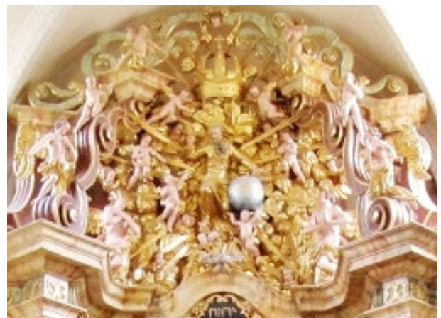
Himmel über dem Altar der Kirche St. Johann/ Herberstein

Damals geschah etwas, auf das weder meine Frau noch ich gefasst waren. Wir hörten