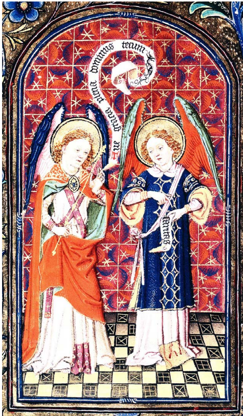
FÜRCHTE DICH NICHT, SPRICHT DER ENGEL (STUNDENBUCH UTRECHT, CA. 1450) ÖSTERREICHISCHE NATIONALBIBLIOTHEK